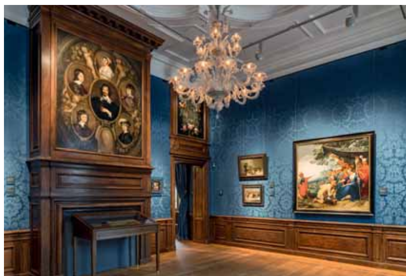
FOTO ONDER Een van de kabinetten, met wandbespanning van zijde en Murano-kroonluchter.